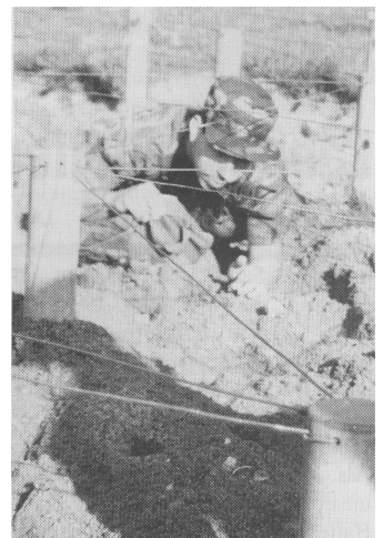
US-Kamerad auf der Hindernisbahn