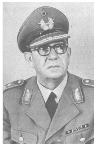
General a. D. Kurt Gerber

Im Namen der Reservisten bedankte sich Hptm d. R. Weis für die Unterstützung durch die Bundeswehr und die französischen Streitkräfte und sprach die Hoffnung aus auf weitere Vertiefung der kameradschaftlichen Kontakte, die immer in friedlichem Wettstreit bestehen mögen.