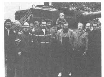
Der erste LEOPARD II der 12. Panzerdivision wurde in Kilsheim in Dienst gestellt. Die Kilsheimer Reservisten besichtigten ihn sogleich. Offiziere der InstAusbKp 512 erklärten alle wesentlichen Funktionen des Fahrzeuges. Unser Bild zeigt die Kilsheimer Reservisten während der Besichtigung.