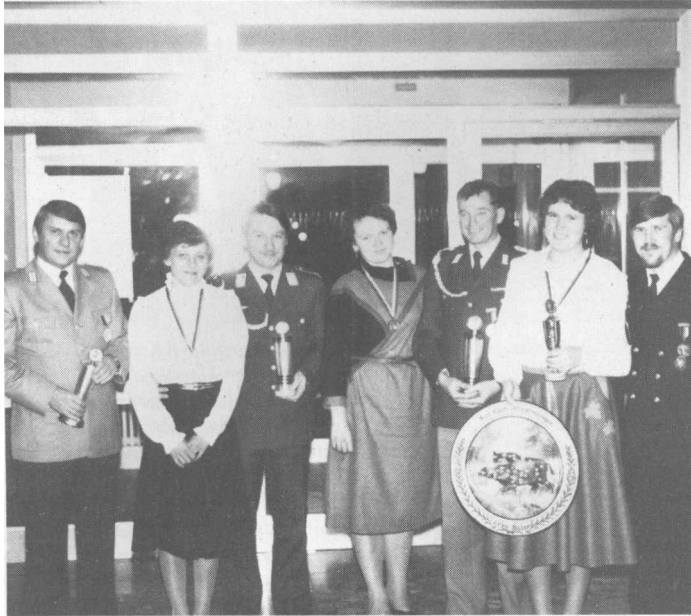
Ehrung verdienter Mitglieder der RK Immendingen