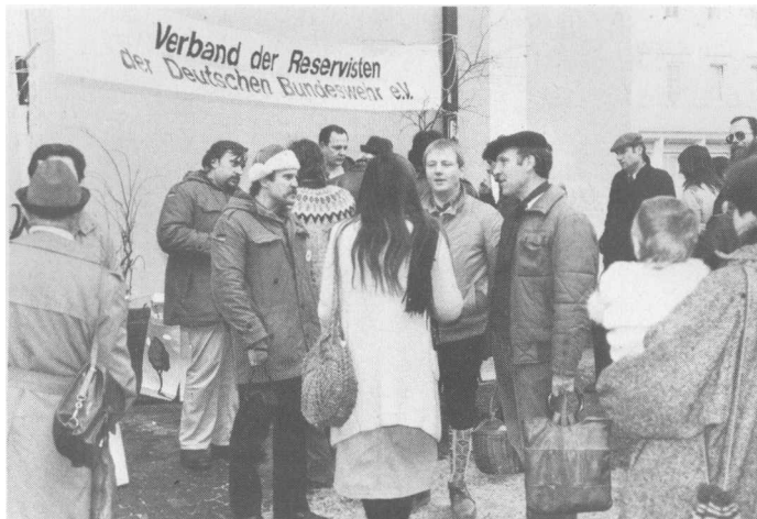
Wie ein Magnet wirkte der Infostand der RK Schwäbisch Gmünd. Diskussionen mit Blockierern aus dem nahegelegenen Mutlangen wurden fair und sachlich geführt.