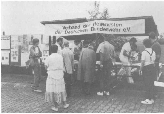
Einen Infostand beim Tag der offenen Tür der PzBrig 28 betrieb die Kreisgruppe Donau-Iller