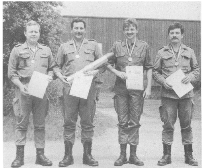
Die Siegermannschaft der RK Vaihingen mit der 8,8-cm-Kartusche.