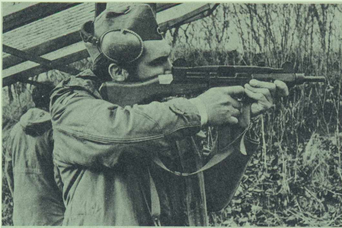
RÜCKBLICK: Kampf um den »Konsul-Dettinger-Wander-Pokal 1974« auf der Standortschießanlage in Freiburg.