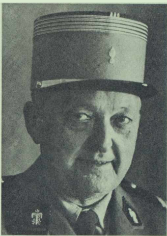
COLONEL PIERRE ORY