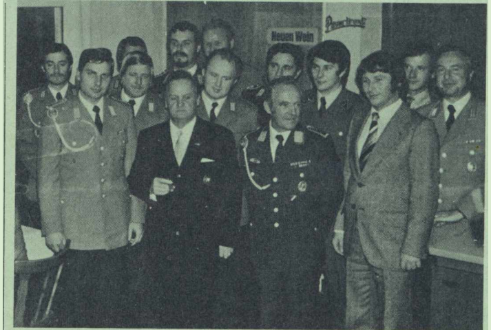
IN ALBERSHAUSEN erhielten zahlreiche Reservisten (unser Foto) ihre Auszeichnungen, die sie im vergangenen Jahr erwarben.